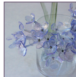
Masami Hirohata - Stand 54

Seit kurzem ist die belgische Gemeinde Raeren Partnerstadt von Höhr-Grenzhausen. Beim Keramikmarkt wird sich Raeren mit seinem Töpfermuseum und einigen Keramiker/innen aus der Region präsentieren. Die Stände befinden sich auf dem Plateau unterhalb des Keramikmuseum Westerwald.