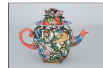
Olga Simonova - Stand 32

Innerhalb der Marktzone wird es an beiden Tagen ein umfangreiches Naspa-Kinderprogramm geben.