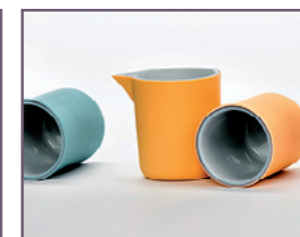
Margot Thyssen - Stand 53