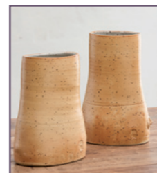
Armin Skirde - Stand 142