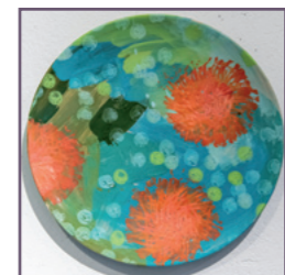
Keramikgruppe (Altweig) - Stand 132