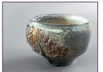
Berthold-Josef Zavacki - Stand 128